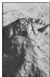
Grotte de hira

il se rendait à la grotte de Hira, dans la montagne de la lumière (jabal an-nur) situé à peu près à 4 km de la Mecque.